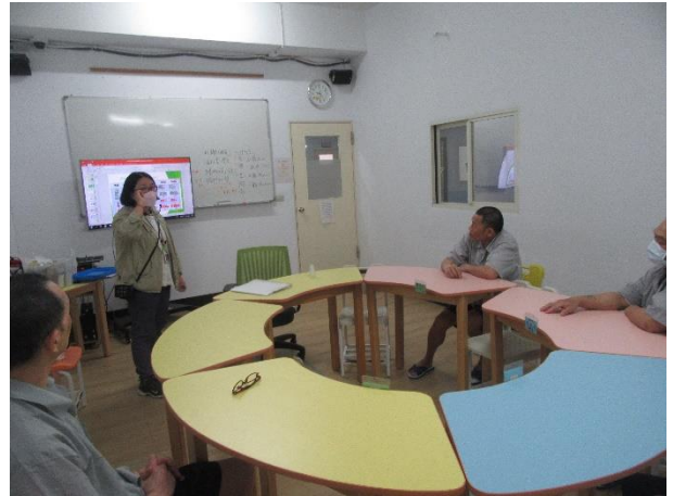
認知輔導教育團體