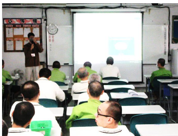
認識酒癮及社區治療資源